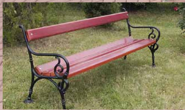
Tartósabbak és időtállóak a tűzhorganyzott padok, ezért szeretnénk folyamatosan lecserélni a közterületen lévő padjainkat.