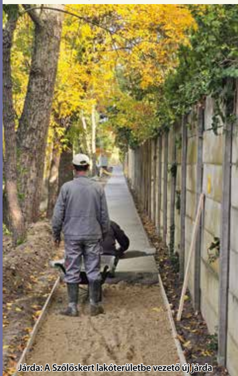
Járda: A Szőlőskert lakóterületbe vezető újjárda

✓ A római katolikus templom mellett jól halad a járdaépítés, ami a legújabb településrészen, a Szőlőskert lakóterületbe költözőknek jelent gyalogos köldökzsinórt a település felé. A templom és a szakkórház kerítésénél a betonozás volt kicsit bonyolult a nagy árok miatt, az utána következő szakaszon pedig járda nyomvonala okozott