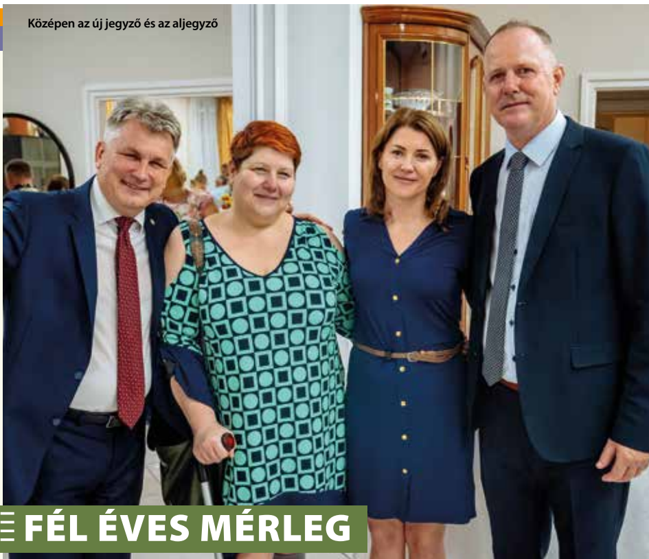
Középen az új jegyző és az aljegyző