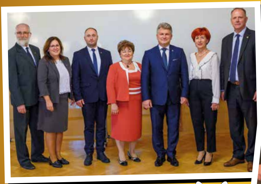
Az eskütelről és az alakuló ülésekről a 2. oldalon olvashatnak.