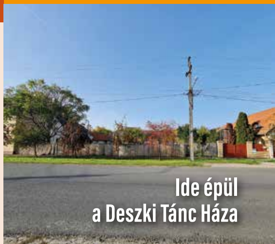
Ide épül a Deszki Tánc Háza

Visszatérve a kérdésre, egyelőre azt mondhatjuk el, hogy a 12 db benyújtott ajánlat között vannak olyanok, melyek beleférnek a pályázatból rendelkezésre álló forrásretbe. Most folynak a már említett tisztázó egyeztetések, és akár egy héten belül is lezáródhatnak. Ennek tudatában kijelenthetem, hogy a Deszki Tükör következő számában már akár újabb szerződéskötésről is beszámolhatunk.