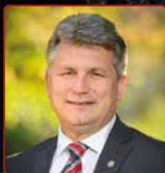
Király László polgármester