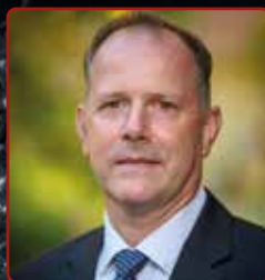
Brczán Krisztfior alpolgármester szerb önkormányzat elnöke