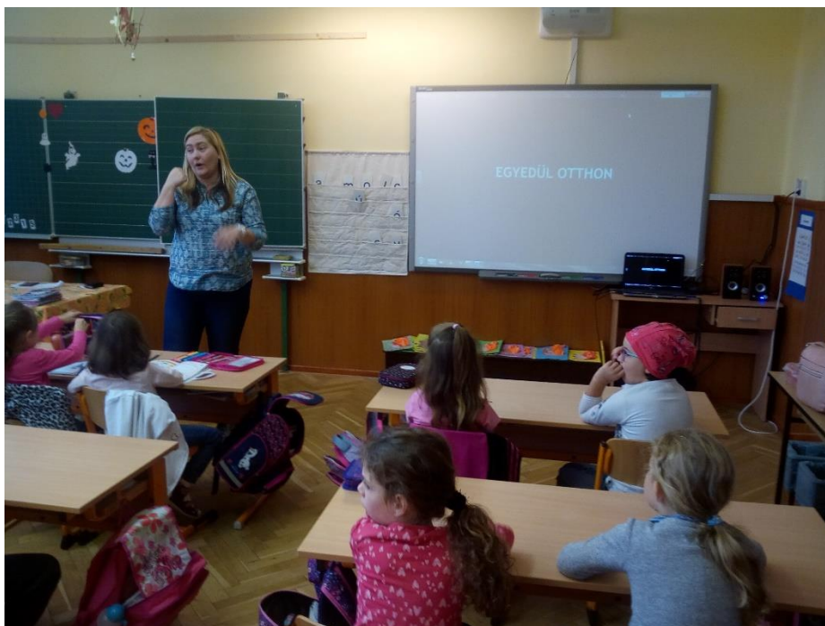
Bűnmegelőzési előadássorozat általános iskolások részére

A Szegedi Rendőrkapitányság előadója az általános iskola osztályainak 45 perces tanóra keretében bűnmegelőzési előadást tartott, mely során az alsó tagozatos diákoknak az otthoni egyedüllétről, illetve az idegenekkel való kapcsolatteremtés szabályairól volt szó. A felső tagozatosok számára az iskolában vagy azon kívül előforduló erőszakos bűncselekményekre, a vagyon elleni bűncselekmények megelőzésének lehetőségeire, valamint a szabadidős tevékenységek során felmerülő bűncselekmények megakadályozására hívták fel a figyelmet.