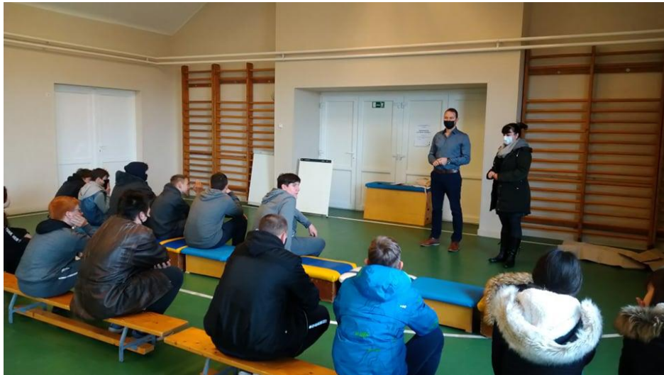
Egészséges életmód fórum

Nem lehet elég figyelmet és időt szentelni az egészséges életmód kialakításának fontosságára. Az egészség megőrzése és az életminőség javítása céljából a lakossági igényeket is figyelembe véve, egészséges életmód fórumot szerveztünk szakemberek, életmód tanácsadó bevonásával. A fórumok a projekt során évente egy alkalommal kerültek megrendezésre.