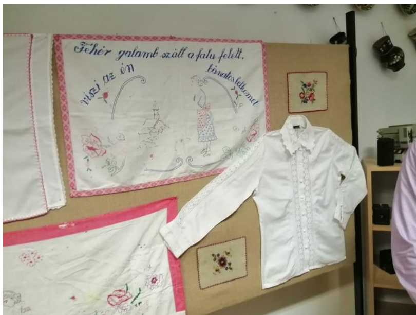
Helyi értékek bemutatása