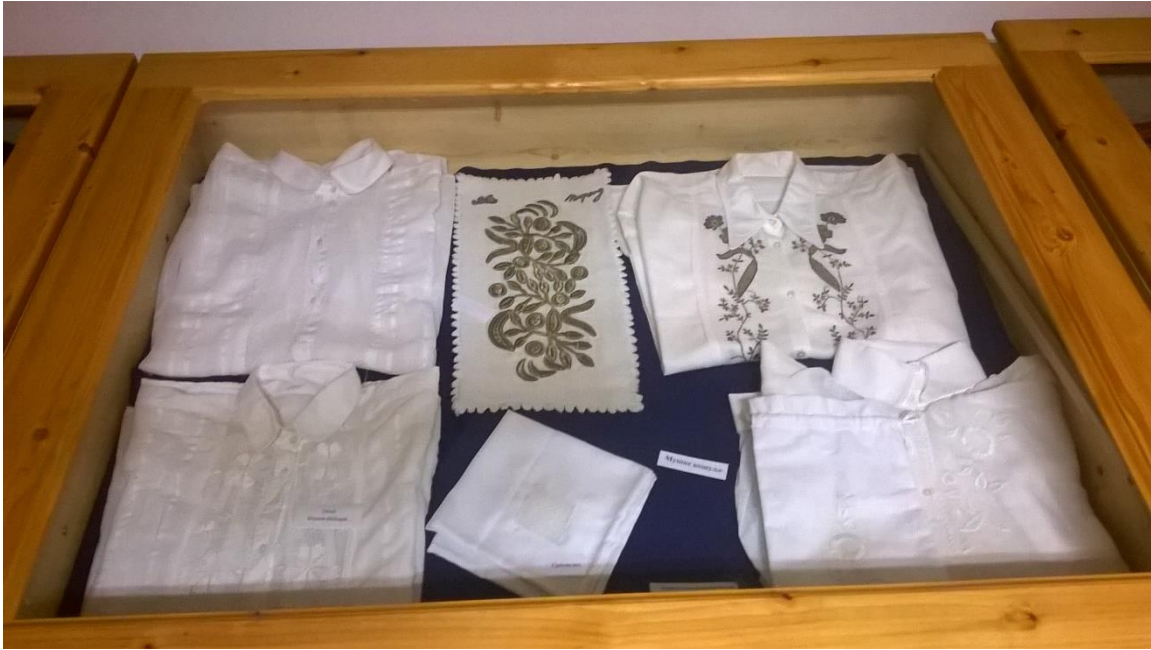
Közösségi helyismereti kiállítás

A Szerb örökségünk kiadvány összeállítása és nyomdai kivitelezése („Bánát” Egyesület). Az előzetes kutató munka által feltárt szakmai anyagok rendezése, összeállítása, szerkesztése és nyomdai kivitelezése valósult meg a projekt keretében.