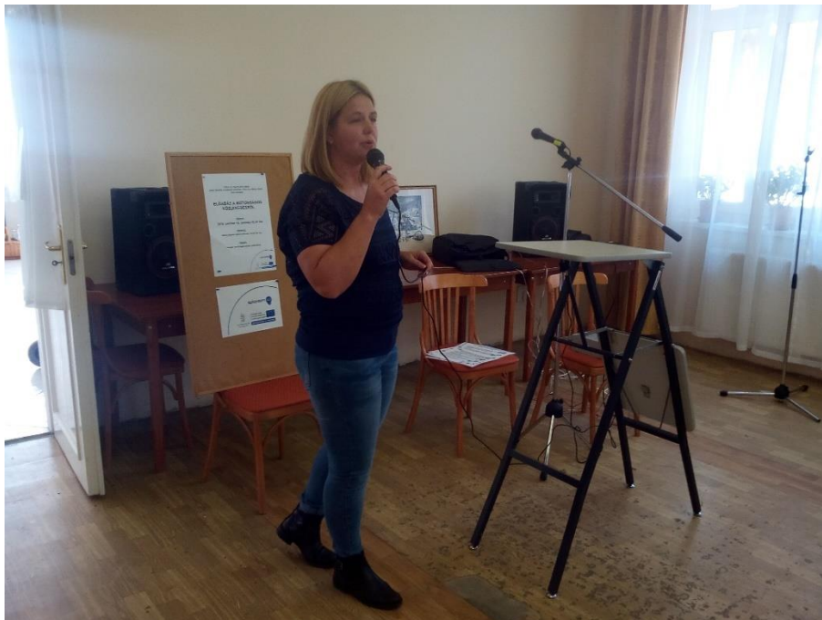
Előadás a biztonságos közlekedésről időskorúaknak