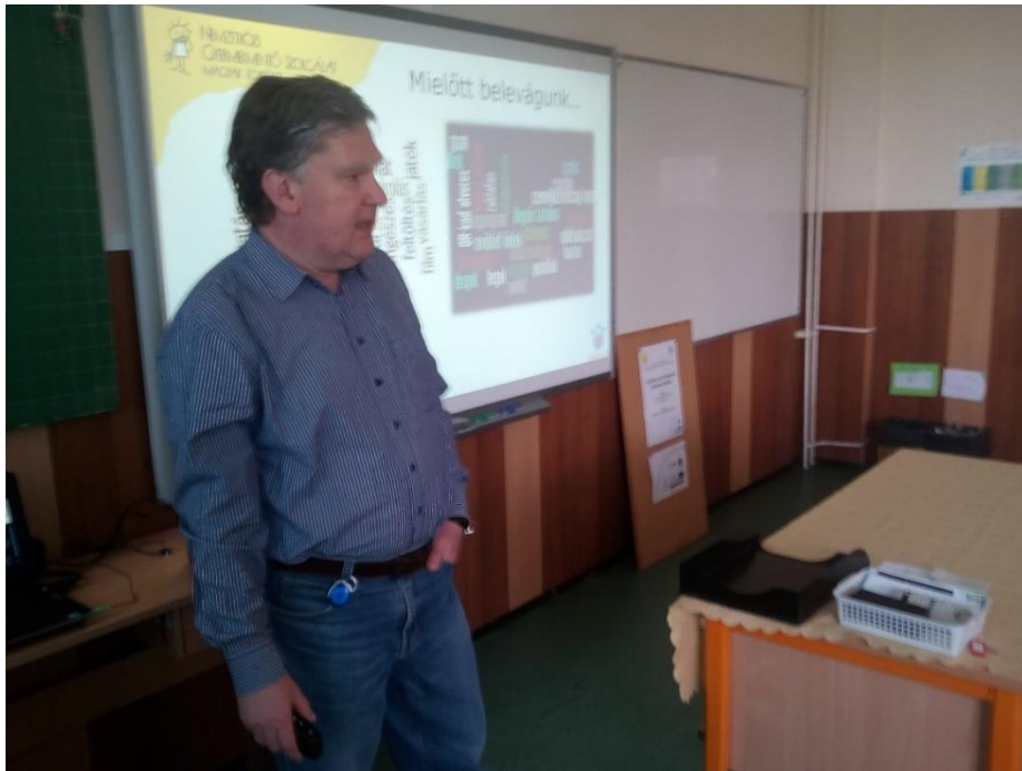
Előadás a biztonságos internetezésről általános iskolások részére

A Szegedi Rendőrkapitányság előadója az általános iskola osztályainak 45 perces tanóra keretében bűnmegelőzési előadást tartott, mely során az alsó tagozatos diákoknak az otthoni egyedüllétről, illetve az idegenekkel való kapcsolatteremtés szabályairól volt szó. A felső tagozatosok számára az iskolában vagy azon kívül előforduló erőszakos bűncselekményekre, a vagyon elleni bűncselekmények megelőzésének lehetőségeire, valamint a szabadidős tevékenységek során felmerülő bűncselekmények megakadályozására hívták fel a figyelmet.