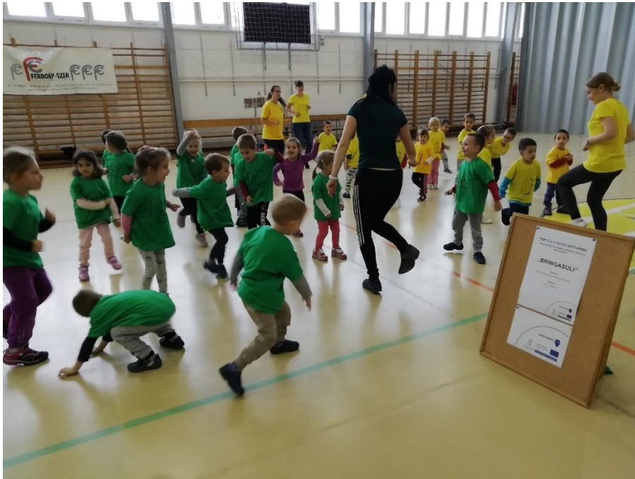
Bringasuli óvodásoknak és iskolásoknak

A közlekedésbiztonsági program keretében a két leginkább veszélyeztetett korosztály számára szerveztünk programot a projekt keretében egy alkalommal a Szegedi Rendőrkapitányság aktív közreműködésével.