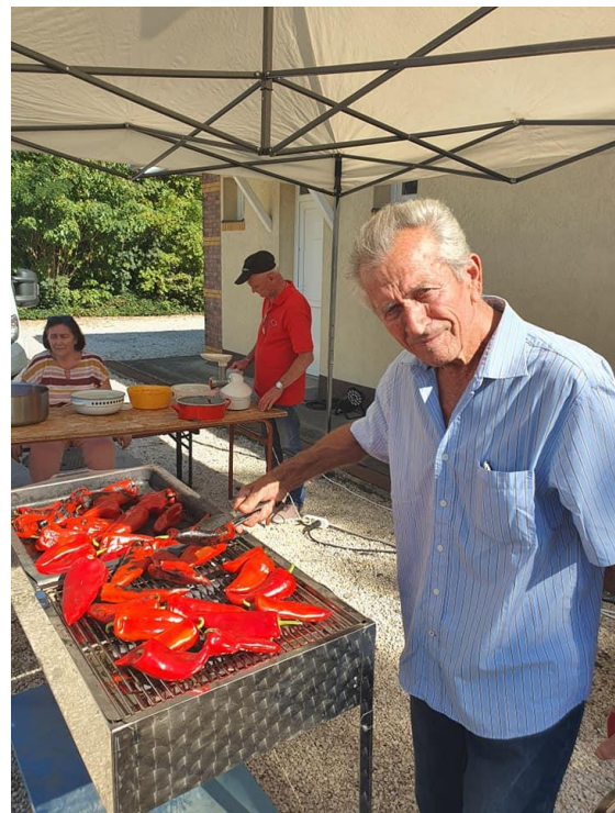
Helyi Értékek Napja

Vállalkozói fórum (Deszk). A projekt előkészítés során felmerült, hogy szükség van a helyi vállalkozások ösztönzésére a község népességmegtartó erejének növelése érdekében. A vállalkozói aktivitás növelése, a fel nem ismert gazdasági potenciál kihasználása nemcsak a település, hanem a térség gazdasági-társadalmi helyzetének javításához is hozzájárul. A fórum célja a helyi közösség aktivizálása, olyan információk átadása, amelyek hozzájárulnak az eredményes gazdálkodáshoz, a vállalkozások versenyképességének növeléséhez. A