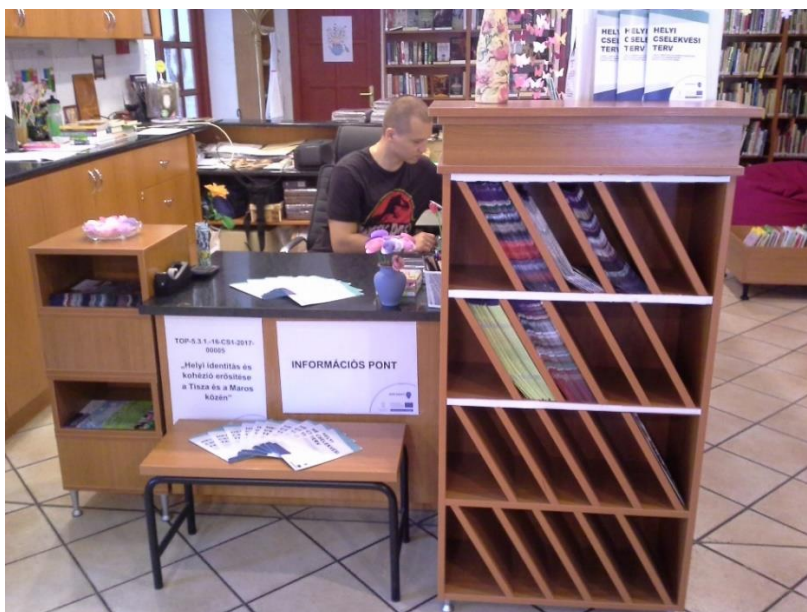
Közösségi Információs Pont

Közösségi Információs Pont (Deszk) kialakítása a helyben tájékozódás lehetőségét nyújtja: sokan a személyesen történő informálódás még mindig inkább előnyben részesítik, mint pl. az online felületeket. A Deszki Művelődési Ház és Könyvtárban egy Közösségi Információs Pont került kialakításra, ahol a közösségfejlesztési folyamatról, a programokról, folyamatokról és a projekt tevékenységeibe való bekapcsolódásról lehet tájékozódni. A Központ célja, hogy az érdeklődők naprakész, megbízható információkhoz jussanak a térségben zajló közösségfejlesztési folyamatról, annak eredményeiről. Az információk birtokában az érdeklődők még inkább sajátjuknak érezhetik a folyamatokat, amelyekhez csatlakozhatnak is.