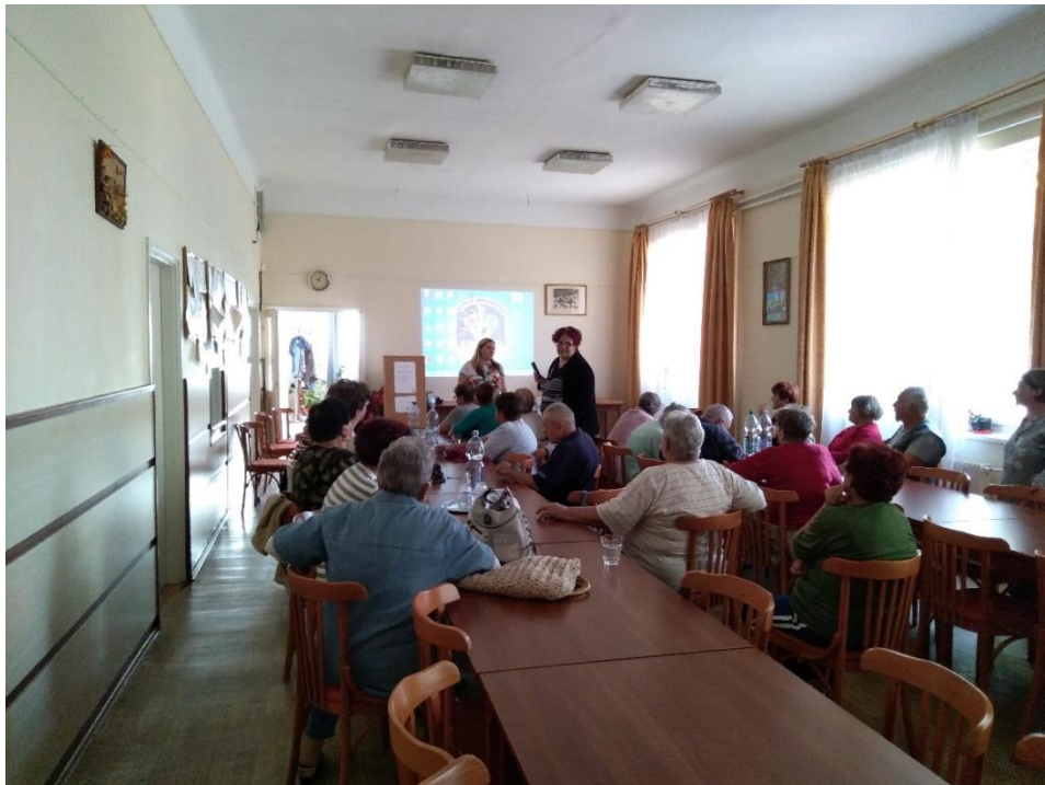
Előadás az időskorúak az áldozattá válásának megelőzésére

Az előadás egy alkalommal a Szegedi Rendőrkapitányság közreműködésével a Deszki Nyugdíjas Klubban került megrendezésre.