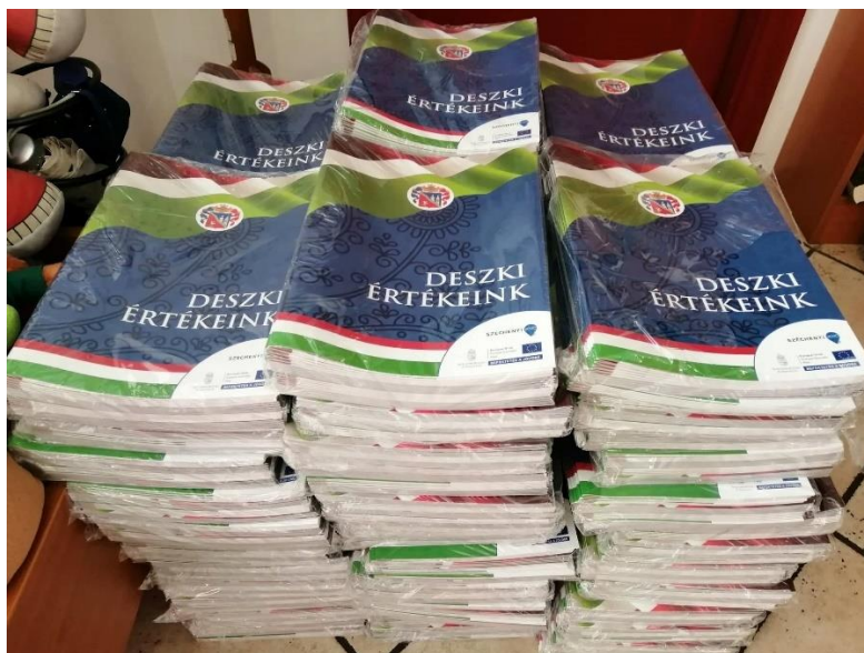
„Deszki Értékeink” kiadvány

Művelődő közösségek ismeretterjesztő rendezvénysorozat (Deszk). A helyi identitás erősítése érdekében olyan programok megvalósítására volt szükség, amelyek összefogják a különböző kulturális tevékenységek köré szerveződő csoportokat, láthatóságuk és társadalmi beágyazottságuk megnövekszik és amely ösztönzőleg hat a lakosság többi tagjára is. A településen működő közösségeket (alkotó és művészeti csoportok, klubok) és a lakosság többi tagját ismeretterjesztő előadássorozat segítségével kívántuk aktivizálni. Az ismeretterjesztő előadássorozat a Deszki Művelődési Ház és Könyvtár intézményében került megrendezésre, mely során olyan személyek tartottak előadást illetve bemutatót, akik az adott területet megfelelő szellemiséggel képviselik, tudásukat, tapasztalataikat, élményeiket közérthető és figyelemfelkeltő formában osztották meg a közönséggel. A rendezvénysorozat a projekt időtartama alatt évente egy alkalommal került megrendezésre.