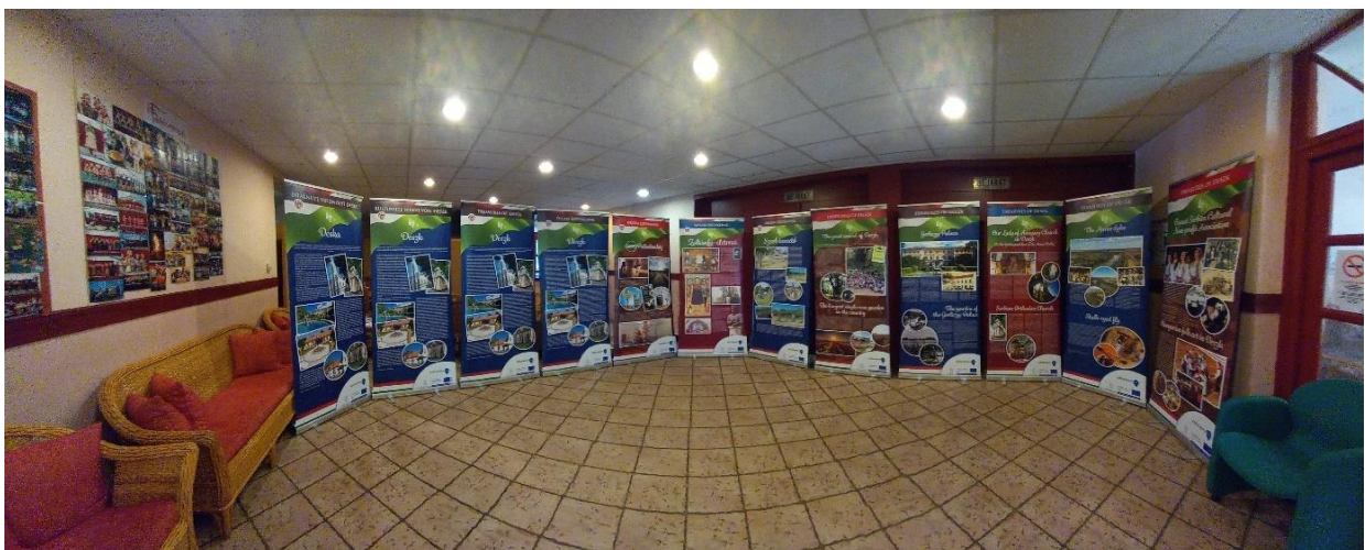
Roll Up-ok a helyi értékekről

Helyi értéktár bővítése, értéktár bizottság működtetése a közösség bevonásával (Deszk). A tevékenység keretében évente egy alkalommal lakossági fórum került megrendezésre, amellyel a Helyi Értéktár Bizottság munkáját kívánta támogatni. Célunk a helyi értékek feltárása, megismertetése és azok megőrzése. A rendezvény a Deszki Művelődési Ház és Könyvtár, a Deszki Falunkért Egyesület, valamint a Deszki Értéktár Bizottság szakmai támogatásával és a helyi közösség aktív közreműködésével valósult meg. A helyi értékek bemutatására 12 db Roll Up készült, illetve igényes kivitelezésű színes nyomdai kiadvány került megjelentetésre „Deszki Értékeink” címmel.