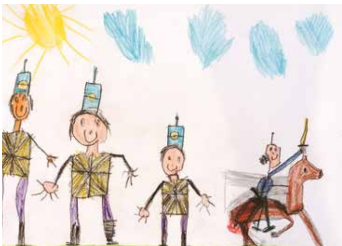
Óvodák egyéni munkái: Lehotai Dávid (Szerb Óvoda) - 1. helyezett